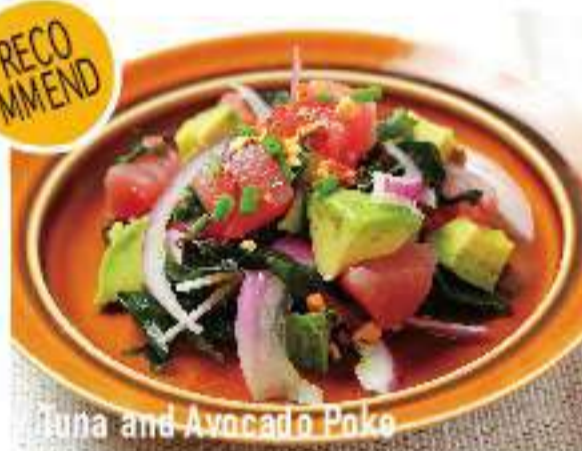
Tuna and Avocado Poke