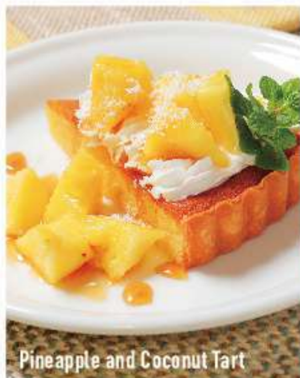
Pineapple and Coconut Tart