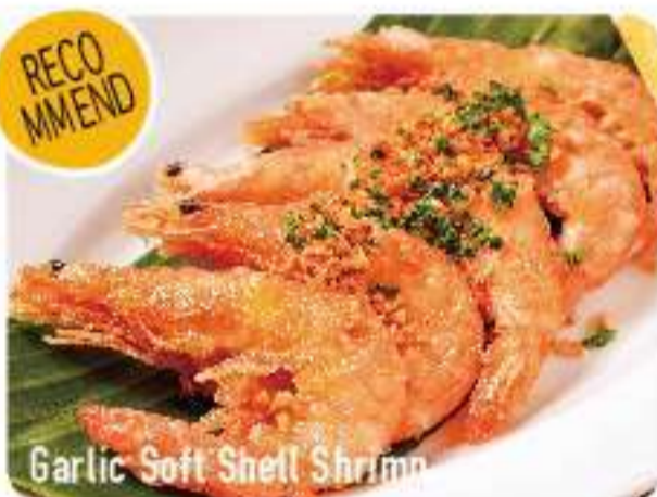
Garlic Soft Shell Shrimp