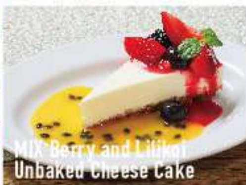
MIX Berry and Lilikoi Unbaked Cheese Cake