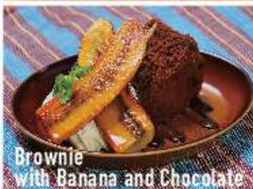
Brownie with Banana and Chocolate