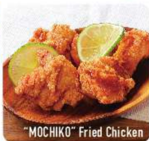
"MOCHIKO" Fried Chicken