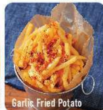
Garlic Fried Potato